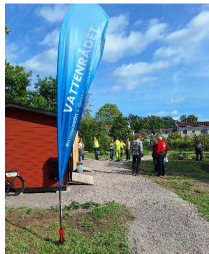
Figur 5 invigning av odlingslotter på Malmen.

Under hållbarhetsveckan bjöd vi på lunchkorv i samband med att nyanlagda odlingslotterna på Malmens i centrala Torsås invigdes. Vattenrådet och Kustmiljögruppen provade ett nytt sätt, att delta i en oväntat/annat sammanhang. Vi delade ut informationsblad om vattenrådets och kustmiljögruppens aktiviteter samt diskuterade vattenhållande åtgärder. Detta bidrog till kontakt med markägare som är intresserade av vattenhållande åtgärder.