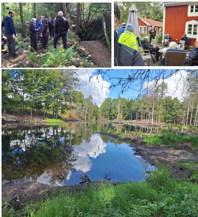
Figur 3 Hållbarhetsresa.

Stopp 2 var vid Kvilla Haget här har en våtmarks utlopp restaurerats, både för dess funktion samt för att fisk ska kunna vandra. En våtmark har skapats genom att ett dike lagt igen. Vid de båda stoppen bjöds deltagarna på förtäring i frukost och fika. Sammanlagt deltog 14 personer i aktiviteten.