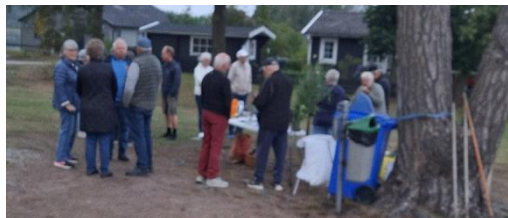
Figur 2 Höstbål

Höstbålet genomförs varje år, sista lördagen i augusti kl. 20:30. Grunden till höstbål är en äldre tradition som kommer från de Baltiska staterna, Finland och norra Sverige. Ett uppsving fick denna tradition när Åbo var Europas kulturhuvudstad 2011. Då de tog initiativ till att sprida traditionen vidare. Numer tänds bål runt vårt innanhav och Östersjöns miljö står i fokus. Höstbålet genomfördes på Nötholmen/Södra Kärr. Det var en blåsig men vacker sensommarkväll med många diskussioner och funderingar. På plats var 25–30 personer, majoriteten boende i närområdet. Utöver diskussioner och funderingar genomfördes tipspromenad och besökarna bjöds på grillat.